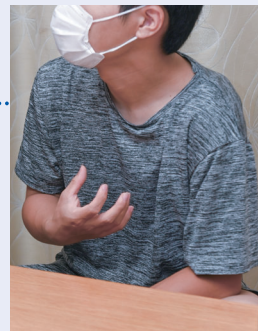
高校に通う男子生徒。昨年母を亡くし、父と弟との3人暮らし

サービスを利用し始めてからは、勉強や息抜きなど自分のことに使える時間が増えました。心に余裕が生まれて、自分の将来のことも考えられるようになりました。もし自分と同じように大変な状況にある人がいたら、サポーターに来てもらうことで精神的にも楽になると思います。ぜひこのサービスを使ってほしいです。