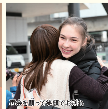
再会を願って笑顔でお別れ