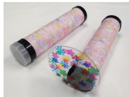
好きな模様で作ろう