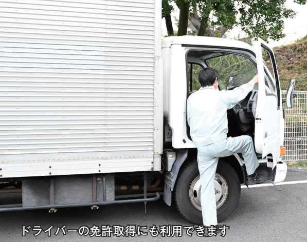
ドライバーの免許取得にも利用できます