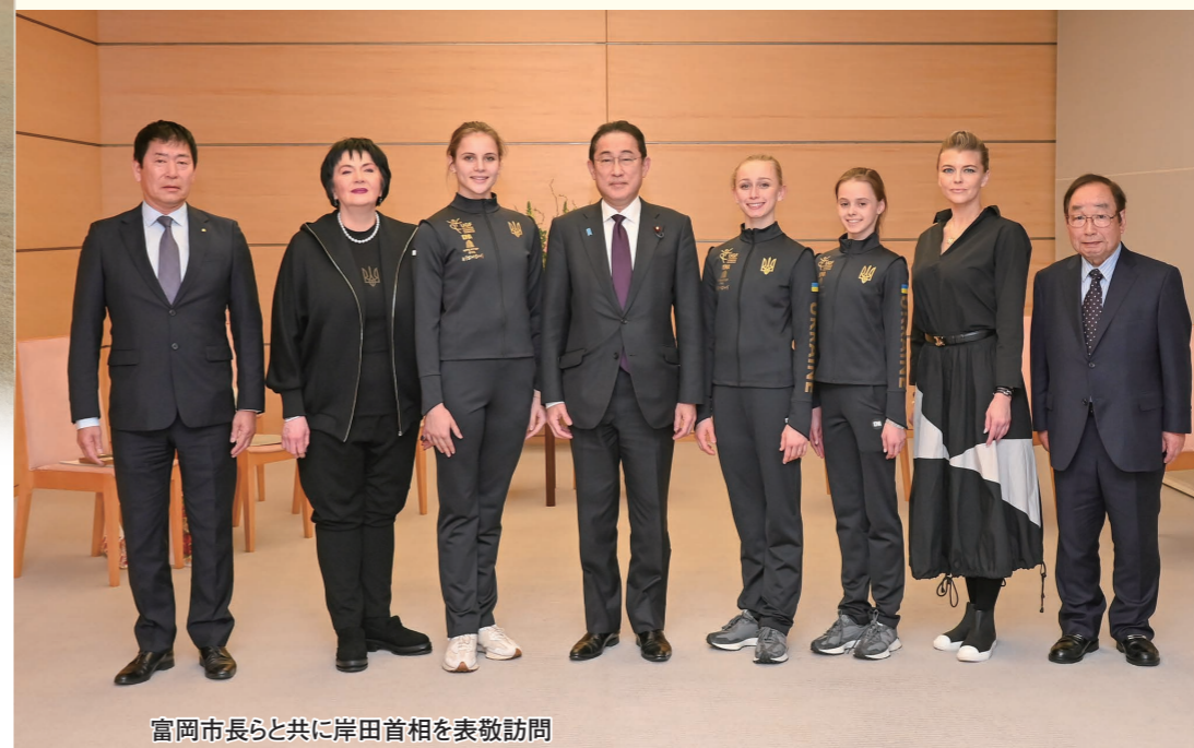
富岡市長らと共に岸田首相を表敬訪問