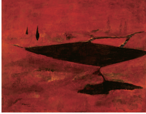
山口薫(水) 1941年 県立近代美術館蔵