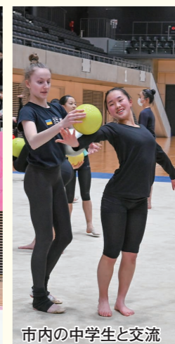
市内の中学生と交流