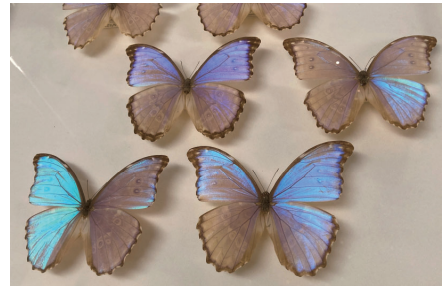
ゴダルトイーモルフォチョウ 県立自然史博物館蔵

●時間＝午前10時～午後6時(金曜日は午後8時まで、入館は閉館の30分前まで) ●休館日＝月曜日(4月29日、5月6日を除く)、5月7日(火) ●観覧料＝一般600円、高・大学生300円、65歳以上と中学生以下は無料