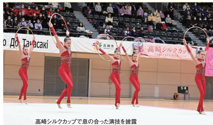
高崎シルクカップで息の合った演技を披露