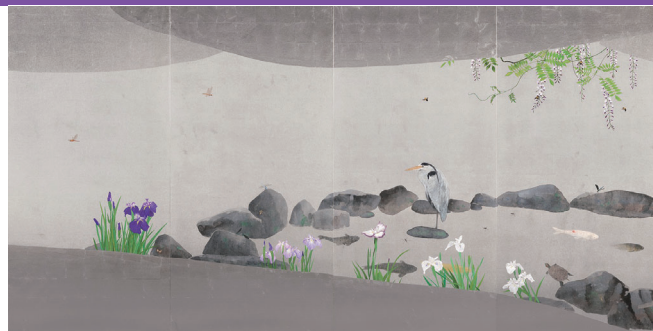
〈千年後の未来〉2023年 太宰府天満宮蔵