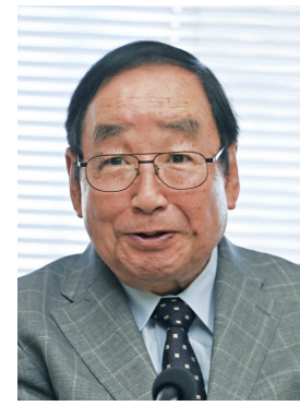
高崎市長 富岡 賢治

令和6年度予算は、引き続き徹底した事業費の削減等を基本方針に掲げた上で、独自の各種ビジネス施策により、地元企業を中心に本市の経済活動を活性化させ、税収基盤の強化を図り、福祉・教育・子育て支援・災害対策を同時に推