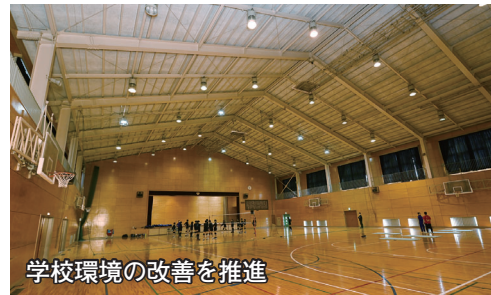
学校環境の改善を推進