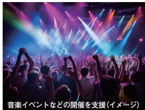
音楽イベントなどの開催を支援(イメージ)