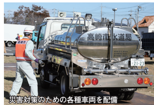
災害対策のための各種車両を配備