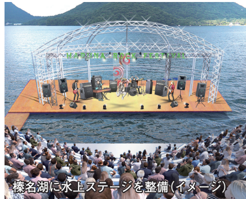
榛名湖に水上ステージを整備(イメージ)