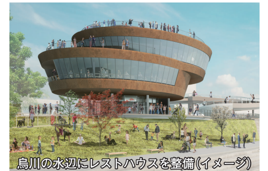
烏川の水辺にレストハウスを整備(イメージ)