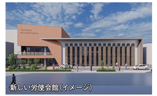
新しい労使会館(イメージ)