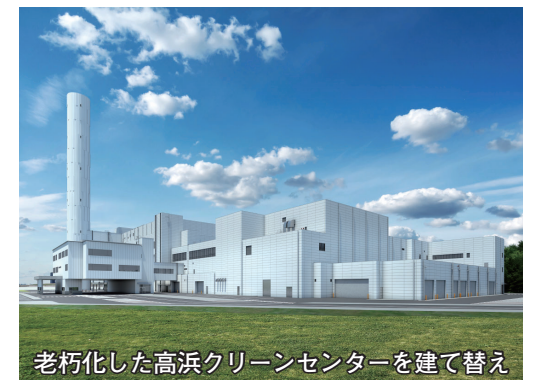
老朽化した高浜クリーンセンターを建て替え