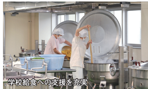
学校給食への支援を充実