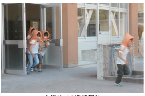
小学校での避難訓練

答弁 指摘があった内容は早速に対応策を講じてきた。今後も利用者からの意見を伺いながら指定管理者とともに引き続きサービスの質の確保、向上に取り組んでいきたい。