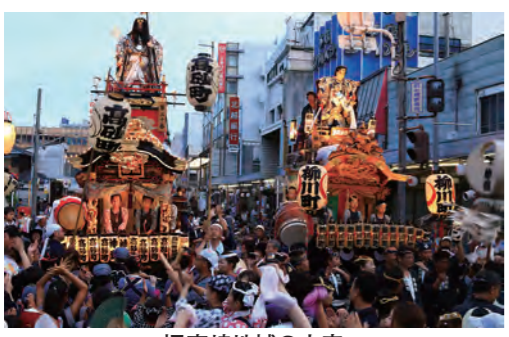
旧高崎地域の山車

答弁 東小学校は、この5年間でおよそ110人増加し、今後増加が見込まれる。一方、城東小学校はこれまで大きな影響を受けずに推移してきている。また、児童増には、まず特別教室を転用して対応し、それでも