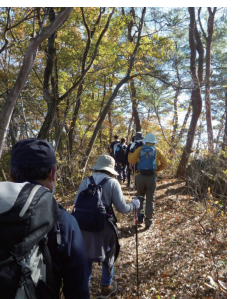
秋の風景を楽しみながら

吉井観光協会は、秋の牛伏山を巡るハイキングを開催します。牛伏ドリームセンターで昼食や入浴も楽しめます。コースは、ゆるやかな林道を歩くコースと、竹林や尾根などの登山道を歩くコースのどちらかを選べます。持ってくる物など