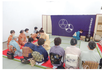
茶道に親しむきっかけに

市と高崎茶道会の合同茶会を開催します。高崎茶道会所属の6流派が一堂に会し、お点前を披露。初心者でも気軽に茶道の体験ができる、市民参加特別席もあります。