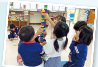
遊びを通じた教育 (幼稚園)