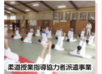
柔道授業指導協力者派遣事業