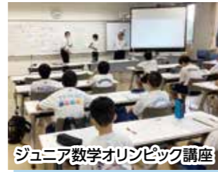
ジュニア数学オリンピック講座