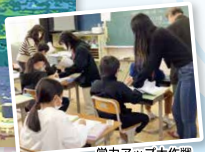
学カアップ大作戦