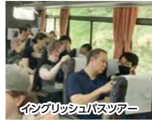
イングリッシュバスツアー