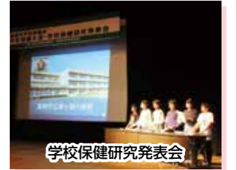
学校保健研究発表会