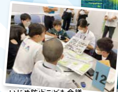
いじめ防止こども会議