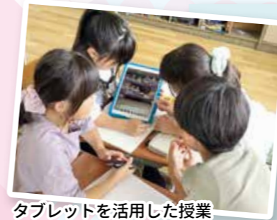
タブレットを活用した授業 (小学校)