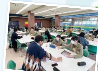
イングリッシュセミナーアドバンスト (高等学校)