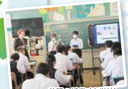
英語の授業(中学校)