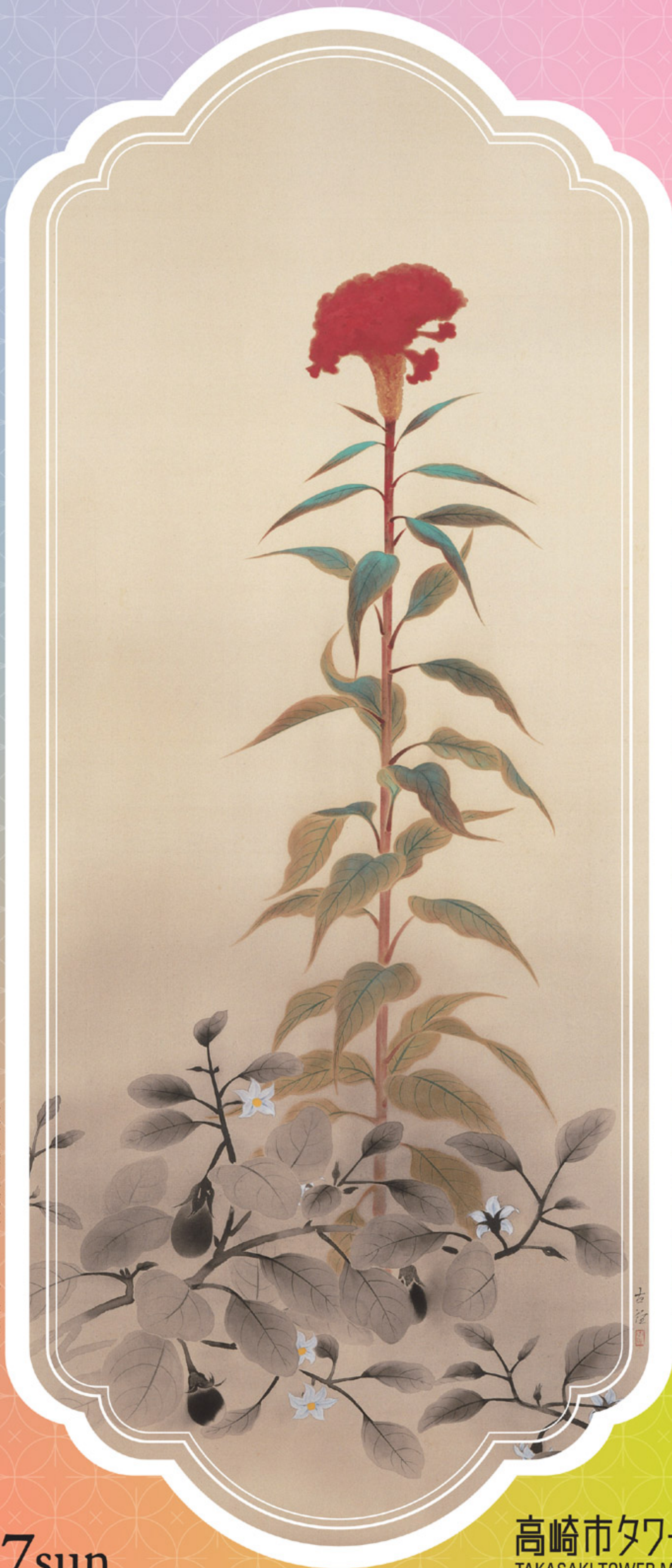
小林古徑(茄子)部分)1930年 寄託作品