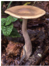
有毒なクサウラベニタケ

毎年9月～11月に、毒キノコによる食中毒が全国で多く発生しています。今年も多くの事例が確認されています。食中毒を防止するため、確実に食用と判断できないキノコは食べないでください。採取、譲渡、販売もしないでください。