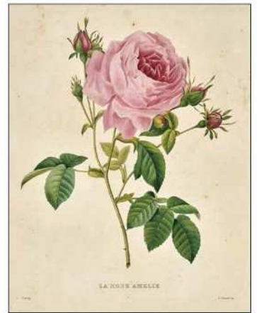
1.ウェッジウッド《平皿「ダーウィン・ウォーター・リリー」(ダーウィン・サービスより)》1808-11年 アースンウェア(陶器)、エナメル彩 2.ウェッジウッド《ポトランドの壺》19世紀(1790年デザイン) ジャスパーウェア(石器) 3.ウースター《ティー・セット「クイーン・シャーロット・パターン」》1755-75年頃 磁器、金彩、エナメル彩 4.ジョセフ・ダルトン・フッカー、ウォルター・フッド・フィッチ《マグノリア・カンベレイ(モクレン科)》1855年 リトグラフ、手彩色、紙 5.ピーター・ヘンダーソン《ゲットウ(ショウガ科)》1801年 銅版、手彩色、紙 6.『カーティス・ボタニカル・マガジン』より シデナム・ティースト・エドワーズ《パンクラティウム・アマンカス(イスマンアマンカ)》(ヒガンバナ科) 1809年 銅版、手彩色、紙 7.ピエール・ジョゼフ・ルドウチ《バラ「アメリカ」(バラ科)》1843年 銅版、手彩色、紙 1,2:Photo Michael Whiteway 3,4,5,6,7:Photo Brain Trust Inc.