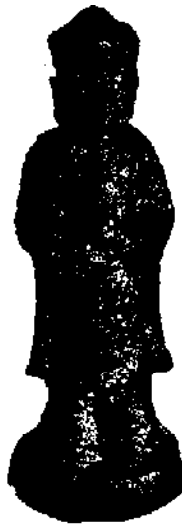
高崎市：剣崎稻荷森遺跡 小金銅仏