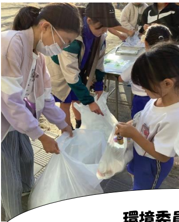
環境委員会の取組 アルミ缶、ペットボトルキャップ 回収の様子

併せて、これまで取り組んできたエコ活動への理解をさらに深め、一人ひとりが意識し自分の身の回りの小さなことから環境活動の輪が広がるよう啓発していきたいです。