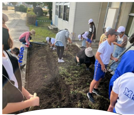
栽培委員会の取組 花壇の整備の様子