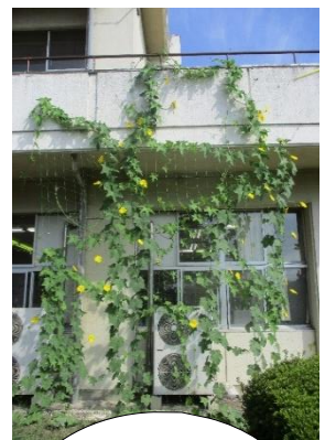
グリーンカー テンの 設置