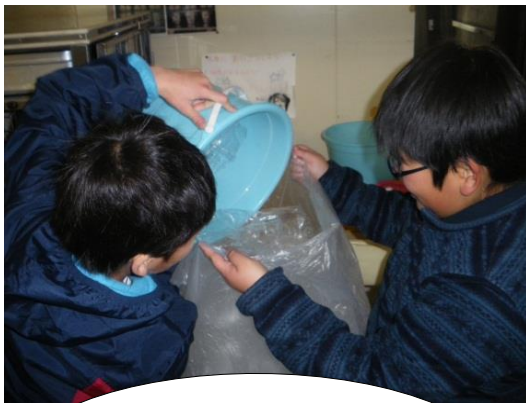
給食委員会の取組 専用のバケツでゴミ 捨てをする様子