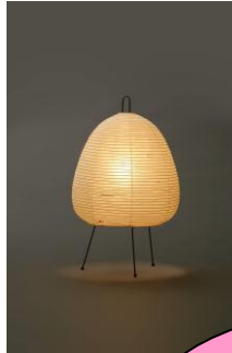
168 あかり 1A