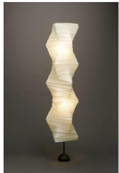
171 あかり 33N