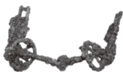
鉄製轡／剣崎長瀬西遺跡（高崎市） ※展示は高崎会場のみ