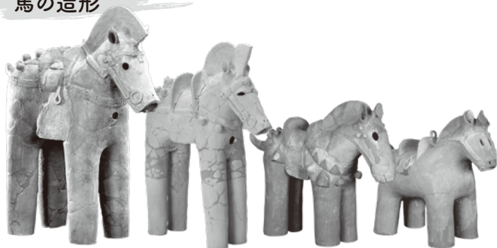
中原Ⅱ遺跡1号古墳（高崎市）