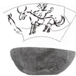
墨画土器／柳久保水田址（前橋市）