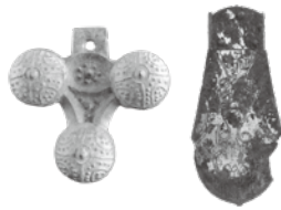
(左)三鈴杏葉／近戸古墳群4号古墳（前橋市） (右)毛彫杏葉／若田B号古墳（高崎市）