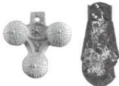
(左) 三鈴杏葉／近戸古墳群4号古墳（前橋市） (右) 毛彫杏葉／若田B号古墳（高崎市）