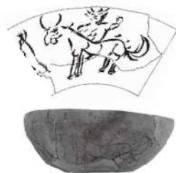
墨画土器／柳久保水田址（前橋市）