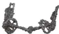
鉄製轡／剣崎長瀬西遺跡（高崎市） ※展示は高崎会場のみ