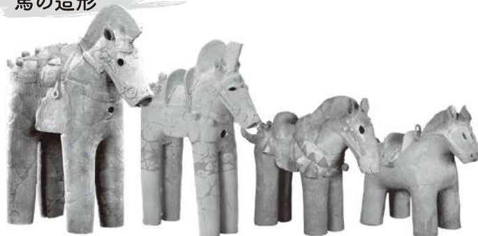
中原II遺跡1号古墳（高崎市）