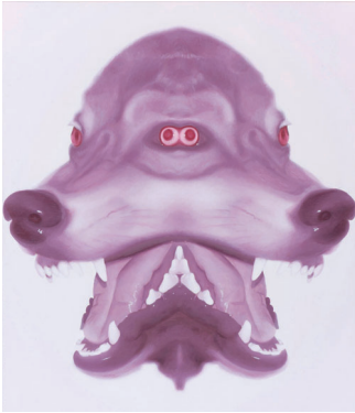
柳ヨシカズ ワイルド ネイチャー 〈wild nature〉 2009年

時間 午前10時～午後6時（金曜は午後8時まで、入館は閉館の30分前まで） 休館日 月曜（祝日は開館し、翌日休館）、2月12日(木) 観覧料 一般300円、高・大学生200円、65歳以上と中学生以下は無料