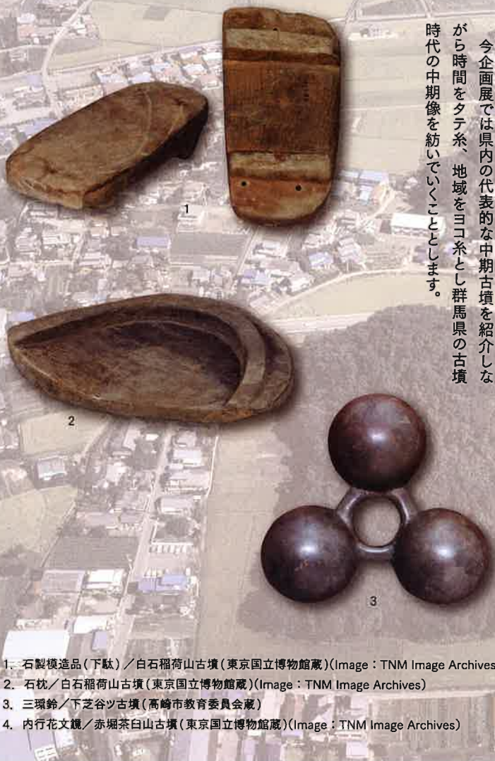
1. 石製模造品(下駄)／白石稻荷山古墳(東京国立博物館蔵)(Image: TNM Image Archives) 2. 石枕／白石稻荷山古墳(東京国立博物館蔵)(Image: TNM Image Archives) 3. 三環鈴／下芝谷ツ古墳(高崎市教育委員会蔵) 4. 内行花文鏡／赤堀茶白山古墳(東京国立博物館蔵)(Image: TNM Image Archives)

今企画展では県内の代表的な中期古墳を紹介しながら時間をタテ系、地域をヨコ系とし群馬県の古墳時代の中期像を紡いでいくこととします。