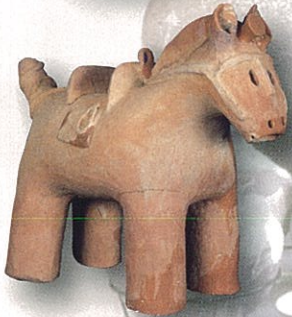
馬形埴輪 白藤古墳群(前橋市教育委員会蔵)