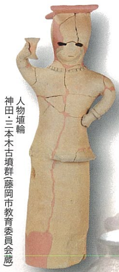
人物埴輪 神田・二本木古墳群(藤岡市教育委員会蔵)