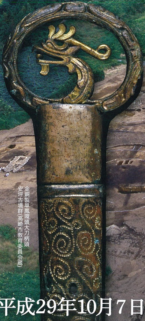
金銅製半鳳環頭大刀柄頭 安坪古墳群(高崎市教育委員会蔵)