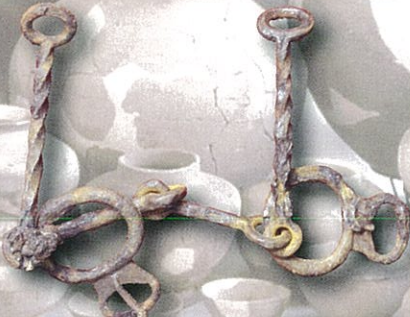
環状鏡板付轡 奥原古墳群(群馬県埋蔵文化財調査事業団蔵)