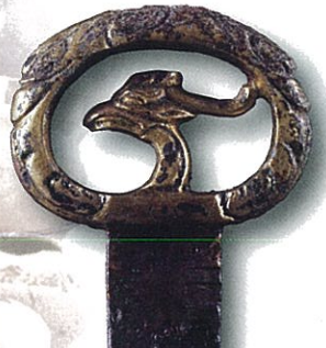
単鳳環頭大刀柄頭 安坪古墳群(高崎市教育委員会蔵)