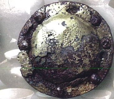
鉄地金銅張杏葉 少林山台古墳群(群馬県埋蔵文化財調査事業団蔵)