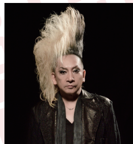
ヤガミ・トール (BUCK ∞ TICK)