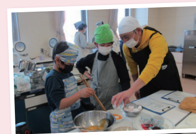
12月に開催したパパと子どもの料理教室の様子