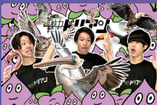
超能力戦士ドリアン