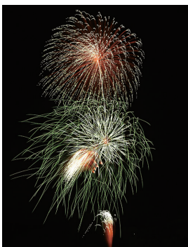
前回の優勝作品 「春の夜に舞う蛍の光」

申し込みは、2月11日(祝)正午までに、市ホームページにある、ぐんま電子申請受付システムで受け付け(申込者1人につき1台)。応募多数の場合は抽選します。