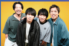
プッシュプルポット