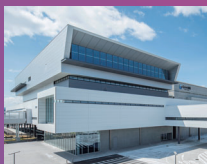
G Messe 群馬