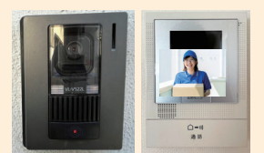
カメラ付きインターホン