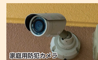
家庭用防犯カメラ