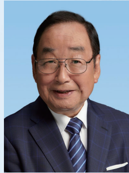
高崎市長 富岡 賢治