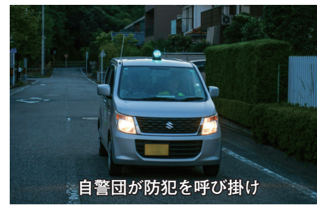
自警団が防犯を呼び掛け