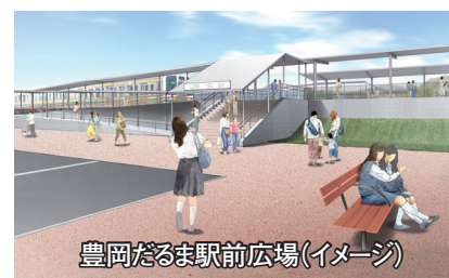
豊岡だるま駅前広場(イメージ)