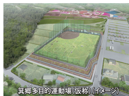
箕郷多目的運動場(仮称)(イメージ)