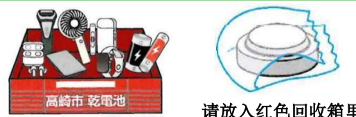
请放入红色回收箱里

装在电器制品里的电池请从电器里取出来 膨胀·变形的东西请直接拿到一般废弃物对策课