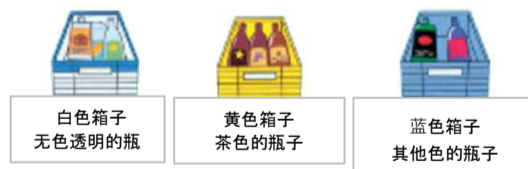
白色箱子 无色透明的瓶 黄色箱子 茶色的瓶子 蓝色箱子 其他色的瓶子