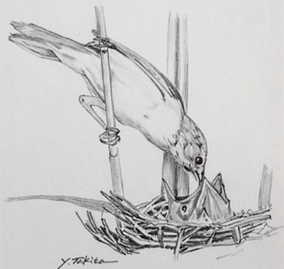
オオヨシキリ 瀧田吉一 鉛筆画「観音山の生き物」より

会期 4月12日(日)まで 会場 染料植物園 染色工芸館 開館時間 午前9時~午後4時30分 入館は午後4時まで 入館料 一般100円 大高生80円 65歳以上・中学生以下・身障者は無料 休園日 月曜日・祝日の翌日・年末年始