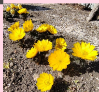
園内の福寿草 2月13日撮影