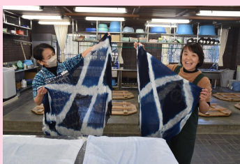
藍染でショールを染める講習会