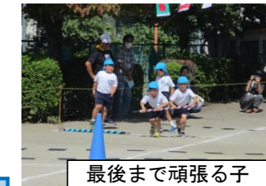
最後まで頑張る子