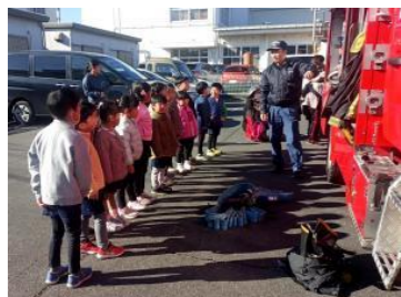
避難訓練（消防署と）

【 目標具現化のための特色ある園活動と行事 】 日々の戸外・室内の様々な遊びを通して活動の楽しさを味わわせ身体と心を育てる保育活動