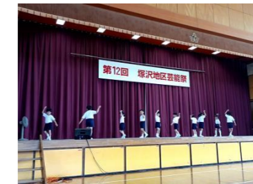
塚沢地区芸能祭参加