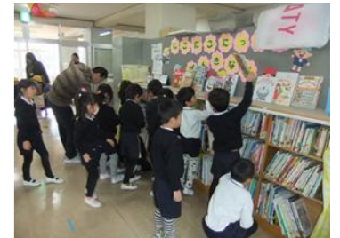
ひまわり文庫の貸し出し