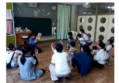
子育て支援（めばえ学級）