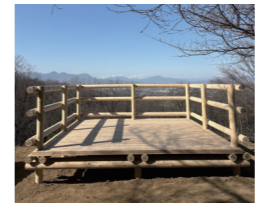
改修したウッドデッキ

答弁 これまでに散策者の安全確保のための支障木の伐採や防護柵の設置、眺望確保のための伐採、山名城址のウッドデッキの改修、案内看板の更新などを実施した。令和7年度は白衣観音付近のトイレ改修について設計委託を実施し、8年度は改修工事を予定している。