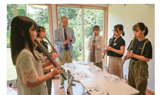
過去の体験会の様子