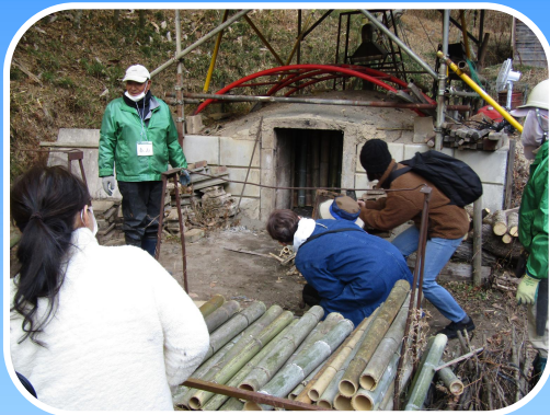
竹あかり作りと炭焼き体験 (令和7年度事業)