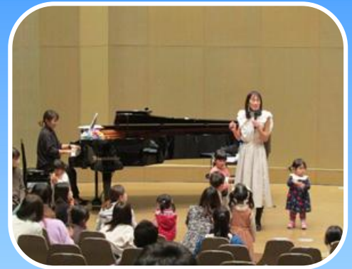
0歳からの親子コンサート (令和4年度事業)