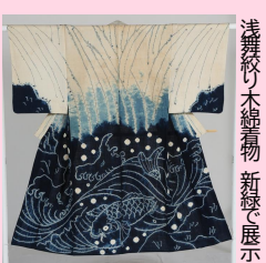
浅舞絞り木綿着物 新緑で展示

■染色工芸館 展示のご案内 『収蔵品展 草木染の美・新緑』 4月14日(火)~6月7日(日) 『収蔵品展 草木染の美・夏』 6月11日(木)~8月2日(日)