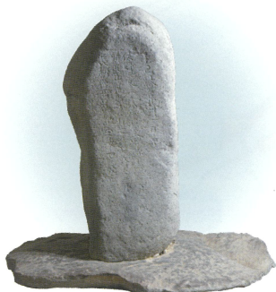
特別史跡 山上碑及び古墳