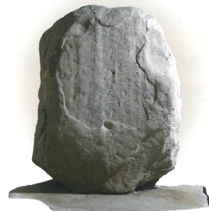
特別史跡 金井沢碑

711年、古代上野国に多胡郡という新しい郡をつくったことを記念して建てられた石碑です。日本三古碑のひとつに数えられます。