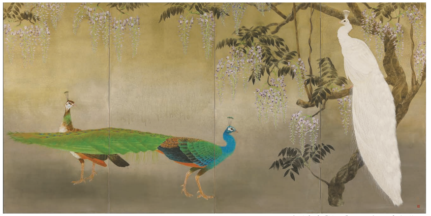
栗原幸彦《閑日》1987年 寄託作品