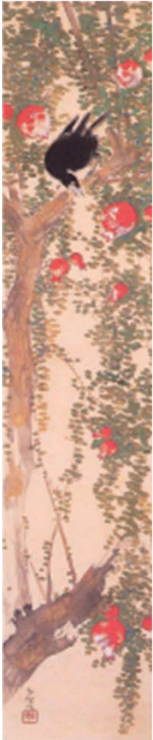
土田麦庵《柘榴呌々鳥》1917年頃 高崎市タワー美術館蔵