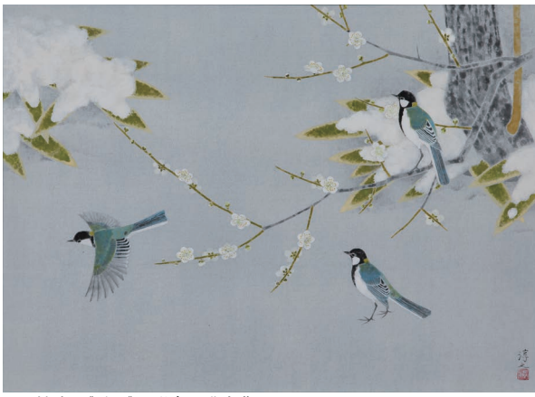
上村淳之《雪野》 湯島天満宮蔵 © Akiko Uemura 2026/JAA2600080