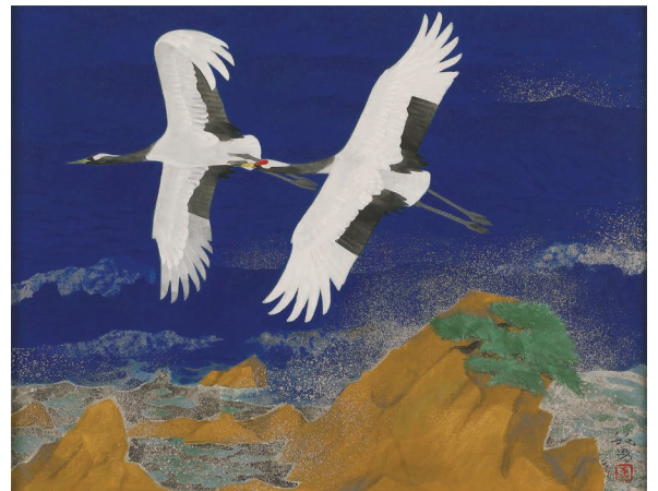
松尾敏男《潮音》 寄託作品