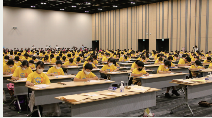
本市では4年ぶりの開催

そろばんの普及と子どもたちの国際交流を目的にしたイベント「2026そろばんワールドシティカップ in TAKASAKI」と、その前夜祭「ワールドナイトマーケット in 高崎」が開催されます。 同大会には、台湾、アメリカ、インドなど7か国から、約500人の子どもたちが出場。真剣にそろばんに打ち込む子どもたちをぜひ会場で応援してください。 問い合わせは、中居幼稚園内のそろばんワールドシティカップ協会（☎027-352-1721）へ。