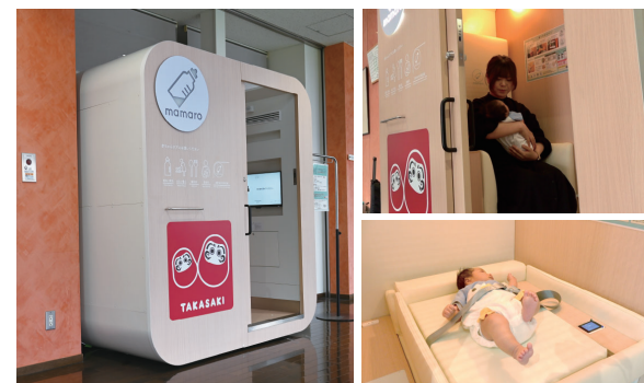
導入したベビーケアルーム。ソファやベッドとして利用できる他、体重測定もできます

他にも、市有施設の福祉避難所に自動ラップ式トイレやダンボールベッド、パーテーションなどを配備。また、孤立集落対策として、発電機や非常用浄水器などを整備し、活用します。