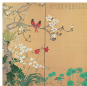
こむろすいろう 小室翠雲 きかいちようす 奇花異鳥図 ささぎ (左隻)1932年

日 7月11日(土)～9月27日(日)、午前10時～午後6時(金曜は午後8時まで、入館は閉館の30分前まで)。7月21日(火)・8月12日(水)・9月24日(木)・月曜休館(7月20日・9月21日は開館)