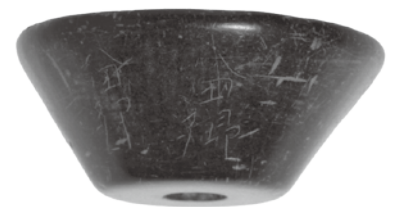
50号住居跡出土 「八田郷 八田郷 八田郷 家郷」の刻字

※写真はすべて矢田遺跡出土 平安時代（群馬県蔵・写真提供）上記3点は複製品の展示となります。