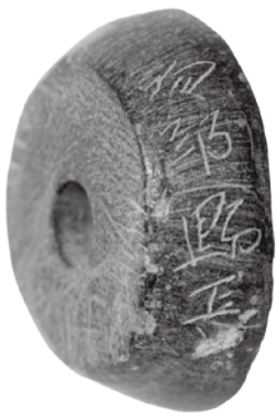
12号住居跡出土 「物部郷長」の刻字

本展が、多様な側面のある紡錘車について考える契機となり、さらに上野三碑の魅力を次世代へと伝える一助となれば幸いです。