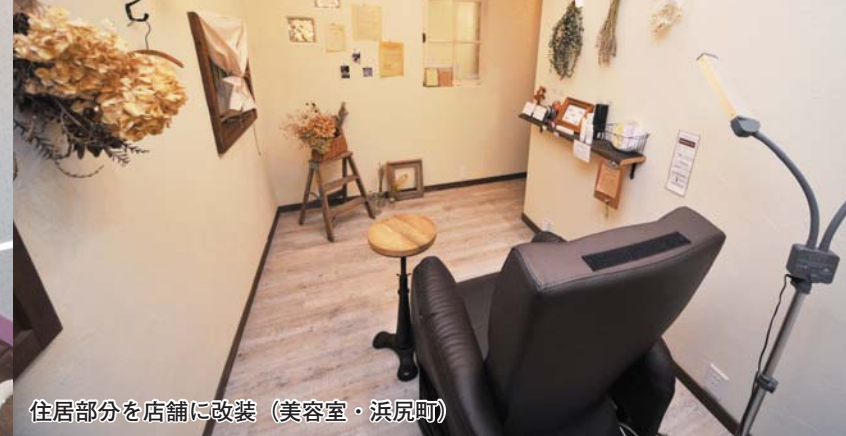
住居部分を店舗に改装（美容室・浜尻町）