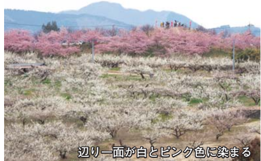
辺り一面が白とピンク色に染まる

梅の生産量東日本一を誇る高崎市。箕郷梅林と榛名梅林では、3月上旬から下旬にかけて合わせて約22万本の梅が見頃を迎えます。期間中、梅の香りや味を満喫できるイベントが開催されます。春の訪れを体感しに、ぜひお出かけください。