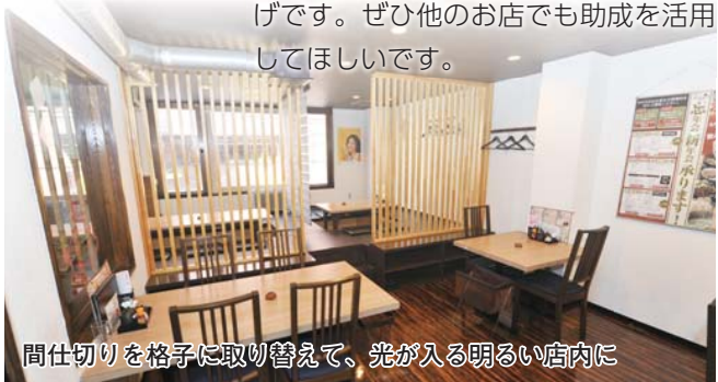
間仕切りを格子に取り替えて、光が入る明るい店内に

開店して7年の豚料理専門店を営んでいます。助成制度を利用して、リニューアルしました。座席の間仕切りを光が入りやすい格子にしたり壁を塗り替えたりして、店内が明るくなりましたね。常連さんからは好評だし、女性のお客さんも増えたんですよ。大きな改装ができたのも、助成制度のおかげです。ぜひ他のお店でも助成を活用してほしいです。