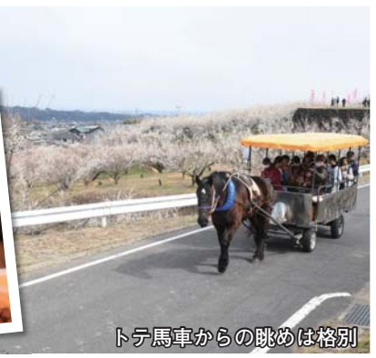
トテ馬車からの眺めは格別