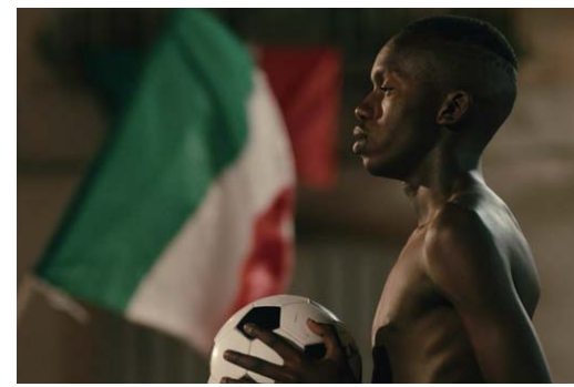
2019年受賞作品「街角のワールドカップ」