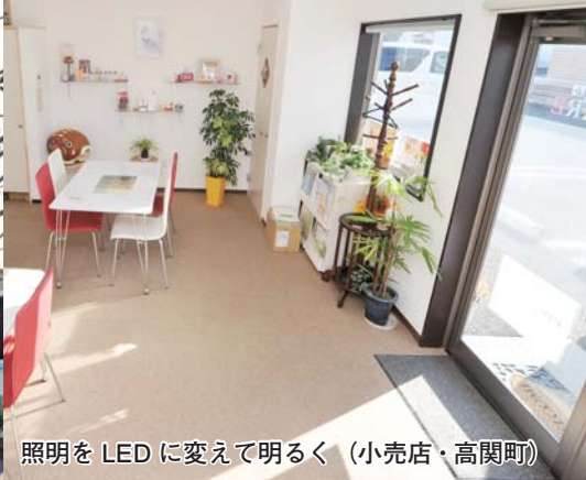
照明をLEDに変えて明るく（小売店・高関町）