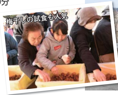
梅干しの試食も人気