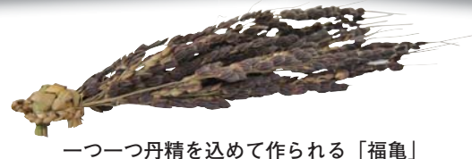
一つ一つ丹精を込めて作られる「福亀」