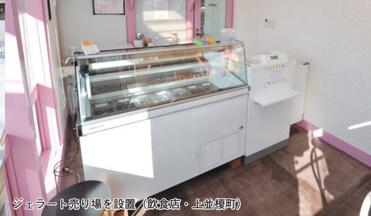
ジェラート売り場を設置（飲食店・上並榎町）