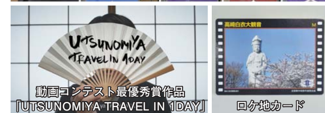
動画コンテスト最優秀賞作品 『UTSUNOMIYA TRAVEL IN 1DAY』