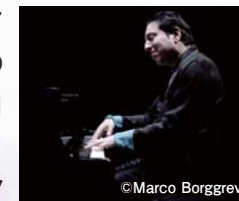
ファジル・サイさん

イ 3/13(金) 電 3/16(月) 窓 3/17(火) 入 6,000円ほか