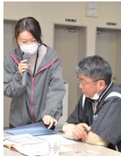
自分に合った改善方法を 申し込み後、3月31日(火)までに、初回の面接を受けてください。

市は、国保特定健診か国保人間ドックを受診して、国保特定保健指導の対象となった人に「特定保健指導利用券」を郵送しています。この券を使うと、医師や保健師、管理栄養士などから生活改善のためのアドバイスが無料で受けられます。特定保健指導の内容や申し込み方法など詳しくは、同封の案内を確認してください。対象者でまだ利用していない人は、日(火)までに、初回の面接を受けてください。