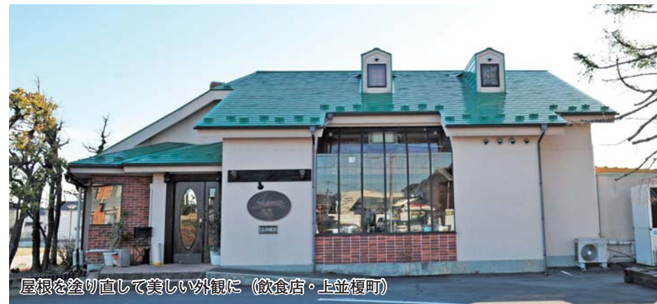
屋根を塗り直して美しい外観に（飲食店・上並榎町）