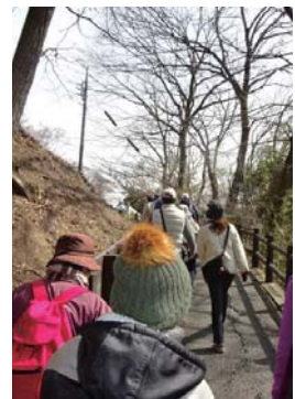
正しい歩き方も学べる

●日時 3月20日(祝)午前10時～正午 ●集合場所 観音山公園 ●内容 年齢や体力などに合わせた運動の指導や助言を行う、スポーツプログラムへの指導を受けながら、観音山周辺を歩く(約5キロ) ●対象 市内に在住か、在勤、在学の小学生以上の人(中学生以下は保護者同伴) ●定員 先着30人 ●費用 1,000円(保険料) ●申し込み 2月21日(金)午前9時から、電話で浜川体育館(☎344-1551)へ