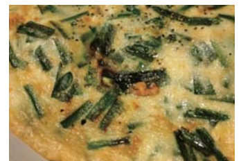
本場の味を家庭で再現

●内容 韓国人の講師の指導で、韓国風お好み焼き・チヂミを作る ●対象 市内に在住か、在勤の45歳までの勤労者 ●定員 16人 ●費用 1,000円