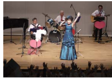
会場一体となって歌おう

吉井文化会館は、生バンドの演奏に合わせて、童謡や歌謡曲など懐かしの名曲を歌い上げる、観客参加型のコンサートを開催します。