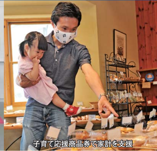
子育て応援商品券で家計を支援