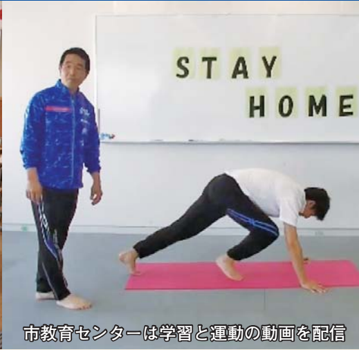
市教育センターは学習と運動の動画を配信