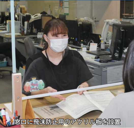
窓口に飛沫防止用のアクリル板を設置