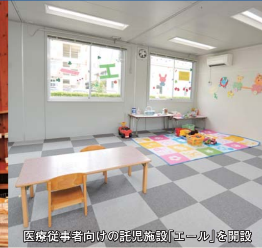
医療従事者向けの託児施設「エール」を開設