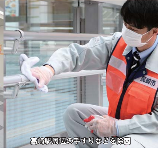
高崎駅周辺の手すりなどを除菌