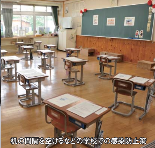
机の間隔を空けるなどの学校での感染防止策