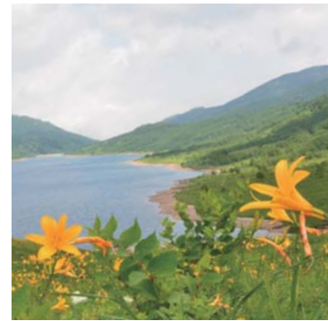
キスゲの広がる湖畔を一望

はまゆう山荘は、ユリ科の花・キスゲが見頃の野反湖周辺を巡るハイキングを行います。温泉入浴もあります。