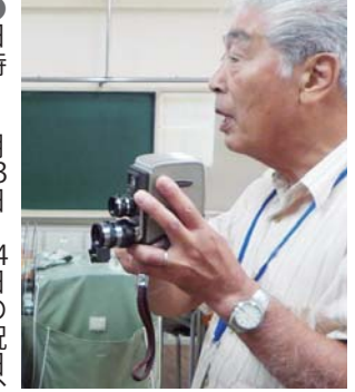
映写機に触れる機会

●日時 7月23日・24日の祝日、午前9時～午後4時30分、計2回 ●会場 高崎商科大学附属高校(大橋町) ●内容 ①インターネットやSNSの活用方法、動画制作、16ミリ映写機の操作、情報モラルについての話など ●対象 市内に在住か通勤、在学の人 ●定員 30人(抽選) ●費用 無料 ●申し込み 6月15日～7月3日(金)に、電話で社会教育課(☎321・1295)へ