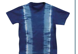
模様は絞り方次第

●日時 7月26日(日)午前10時～午後3時 ●内容 藍染で親子ペアのTシャツを染める ●対象 小・中学生とその保護者(2人1組) ●定員 先着4組 ●費用 1組6,000円 ●申し込み 6月27日(土)午前9時30分から、電話で同園へ