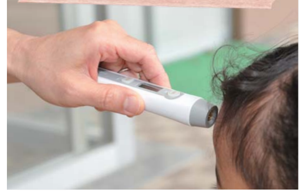
登校時に全児童生徒の検温を実施