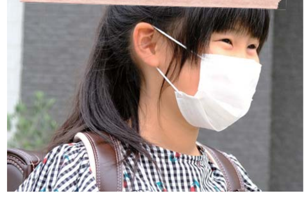
児童生徒に1人10枚のマスクを追加配布