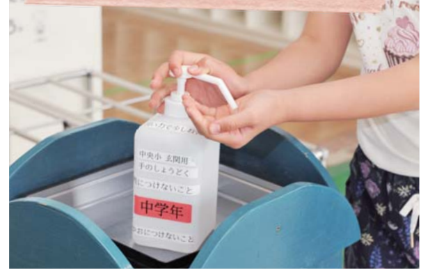
玄関などに手指用の消毒液を設置