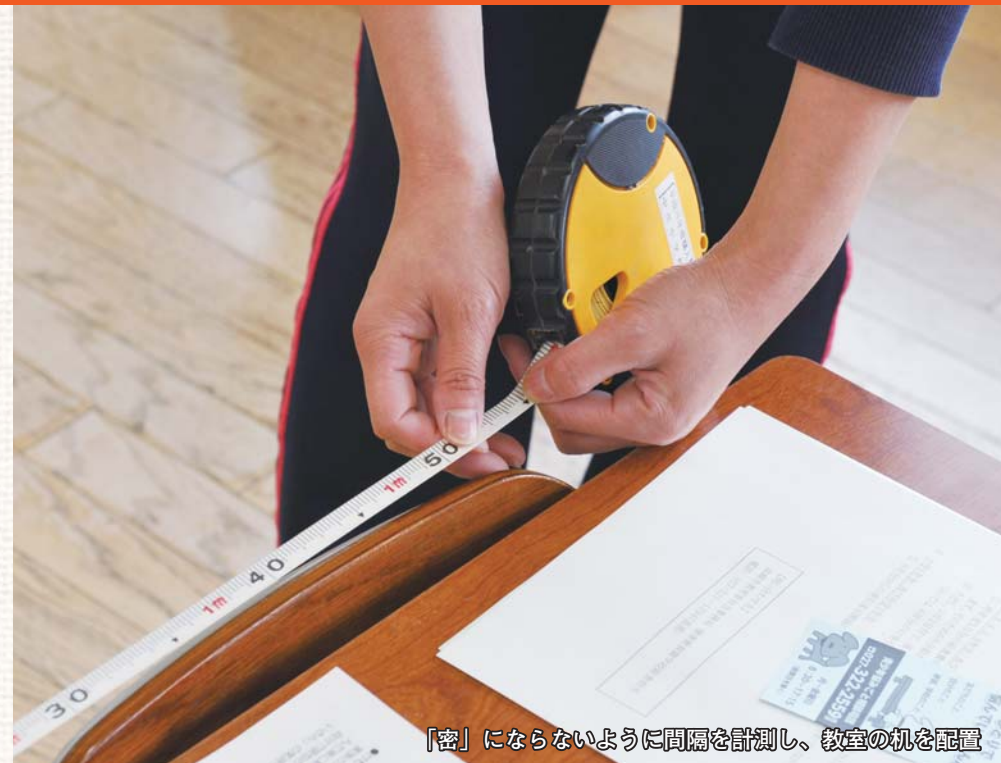
「密」にならないよう間隔を計測し、教室の机を配置

う運動は当面の間控える 出席について 発熱や咳などの症状が出ている場合や、感染拡大防止のために登校を控える場合は、欠席扱いにしません。 放課後児童クラブ、保育所、幼稚園なども通常開所 6月1日の学校再開に合わせて、放課後児童クラブは通常通りの開所体制になります。また、保育所・認定こども園・幼稚園は、登園の自粛を解除し、通常通り再開します。