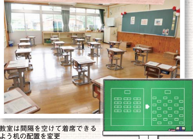
教室は間隔を空けて着席できるよう机の配置を変更