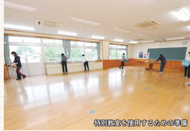
特別教室を使用するための準備