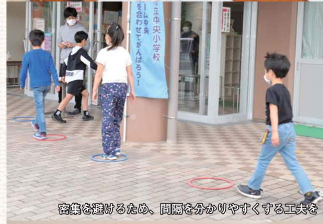
密集を避けるため、間隔を分かりやすくする工夫を