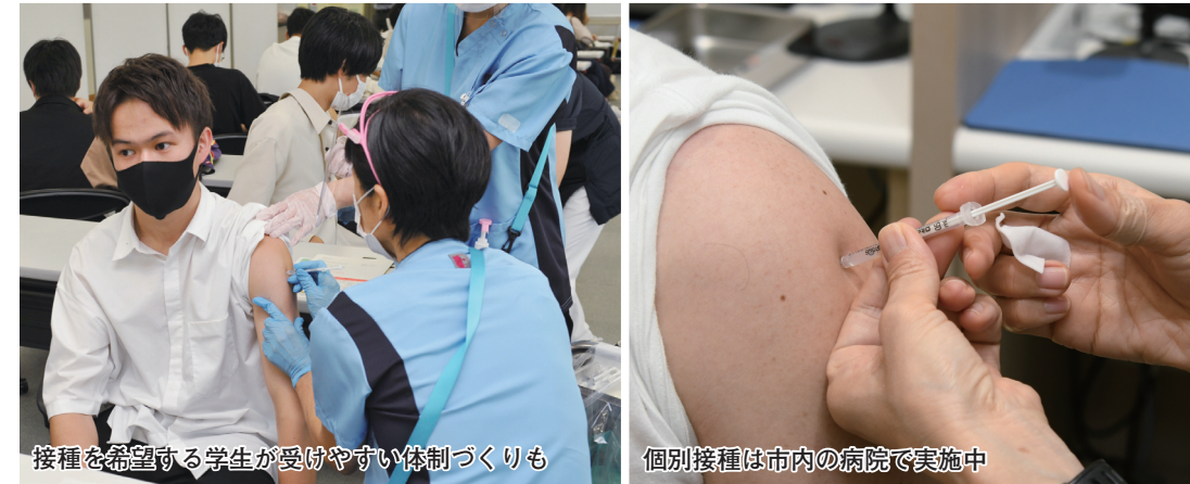
接種を希望する学生が受けやすい体制づくりも