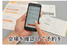
会場を確認して予約を

実施日時は、会場ごとに異なります。ワクチンは、県央ワクチン接種センター分室ではモデルナ社製を、それ以外の11病院ではファイザー社製を使用。医療機関によって、接種できる年齢に制限がある場合があります。予約のときに確認してください。