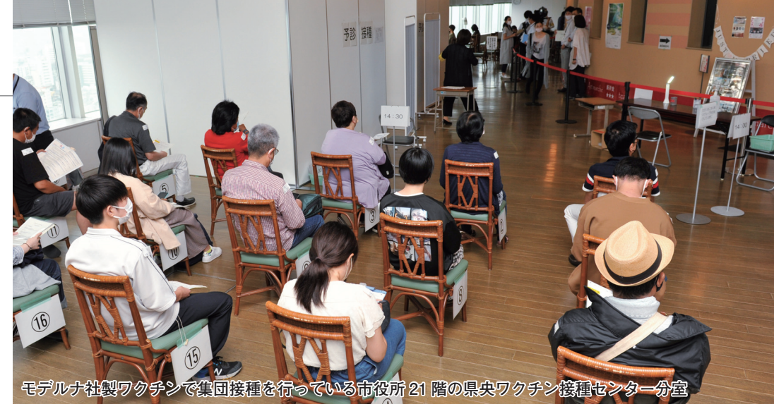
モデルナ社製ワクチンで集団接種を行っている市役所21階の県央ワクチン接種センター分室