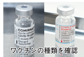
ワクチンの種類を確認