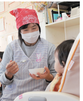
子どもの成長を見守る

市は、来年4月から市立保育所(園)に勤務する嘱託職員を募集します。通勤費、期末手当、有給休暇があります。 ●試験日=来年2月5日(土) ●職種と採用予定人数 ①保育士=10人 ②給食技士=2人 ●受験資格=①保育士資格のある人か来年3月までに取得見込みの人②調理のできる人 ●試験内容=面接 ●申し込み=12月16日(木)~1月17日(月)に、市役所1階保育課と各支所市民福祉課で配布している申込書に記入して、保育課(☎321-1246)へ。申込書などは、市ホームページからダウンロードもできます