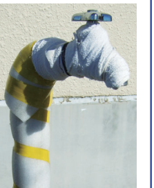
水道管も防寒対策を

水道管の凍結にご注意を 寒い日が続くと、水道管や水道メーターの中の水が凍って、水が出なくなったり、水道管が破裂したりします。水道管を毛布や布、保温材などで覆って凍結を防いでください。家を長期間空けるときは、メーターボックス内の止水栓を閉め、蛇口を開けておくと、凍結による水道管の破裂を防ぐことができます。 水道が凍結した場合は、自然に溶けるのを待つか、凍った部分をタオルで覆い、ぬるま湯をゆっくりかけてください。熱湯を直接かけると水道管が破裂することがあります。破裂したときは、止水栓を閉めて、水を止めてください。修理は市指定給水装置工事店に依頼してください。 問い合わせは、水道局工務課(☎321-1284)か倉洲支所農林建設課、箕郷・群馬・新町・榛名・吉井の各上下水道お客様センターへ。