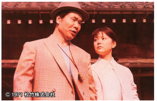
男はつらいよ～奮闘篇

高崎電気館は、渥美清主演映画「男はつらいよ」シリーズの新春上映会を開催します。名優の田中邦衛や八千草薫などが出演した作品を上映。上映時間など詳しくは、同館(☎395-0483)へお問い合わせください。 期日 来年1月2日(日)～10日(祝)(6日(木)を除く) 会場 高崎電気館(柳川町) 上映作品 男はつらいよ～奮闘篇、男はつらいよ～寅次郎夢枕 入場料 1作品1,000円 チケット 当日券だけ。上映日の午前10時30分から発売