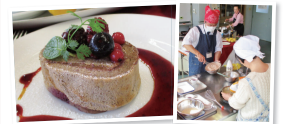
フランスで修行を積んだ講師が指導

青年センターは、ケーキ作りの講座を開催します。バレンタインに向けて、チョコレートクリームを使ったロールケーキを作ります。 ●日時 来年2月5日・12日の土曜日、午後1時～3時30分 ●会場 青年センター ●対象 市内に在住の18歳以上の人(初めての人を優先) ●定員 各8人(抽選) ●費用 2,500円 ●申し込み 12月15日～28日(火)に、往復はがきに住所・氏名・電話番号・希望日を書いて、〒370-1206台新田町314 青年センター (☎346-0251) へ。1人1枚の応募