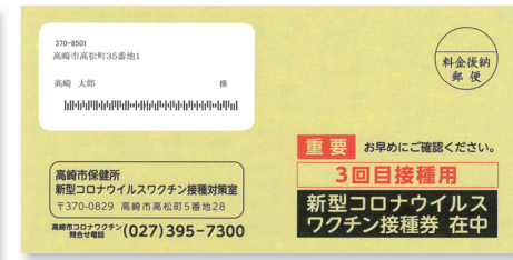
▲接種券などを送付する専用の封筒