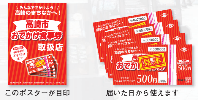
このポスターが目印 届いた日から使えます