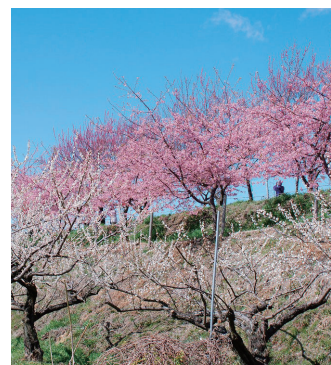
梅と河津桜の共演を楽しむ