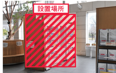
市民ロビーなどに置く

市は、市役所本庁舎内の飲料自動販売機の設置業者を募集します。対象は、市内に本社が事業所があり、故障などに速やかに対応できる事業者です。