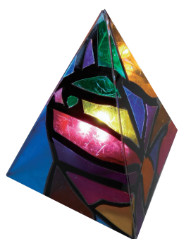
自由に模様をデザイン

2月2日(火)は、保守点検のため上映を休止します。 プラネタリウムの放映休止 ●期日 2月27日(土) ●会場 創作室 ●内容 色付きの半透明なシートを貼り付けて、ステンドグラスのようなピラミッド型のランプカバーを作る ●定員 18人 ●費用 500円 ●締め切り日 2月11日(祝) プログラミング2月 ●期日 2月28日(日) ●会場 パソコン室 ●内容 プログラミング言語「スクラッチ」を使って、幾何学模様を描く ●定員 10人 ●費用 無料 ●締め切り日 2月18日(木)