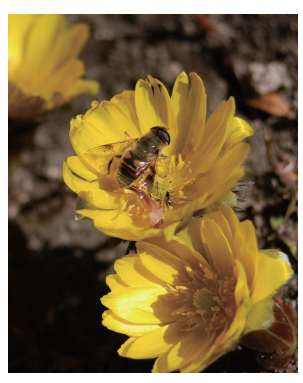
フクジュソウなどを見る

●期日 ①草木染 2月3日(水)・7日(日) ②草花染 2月11日(月)・15日(金) ●会場 総合福祉センター ●内容 草木染は、植物の色素を使って布を染める。草花染は、花の色素を使って布を染める。どちらも、色づき橋周辺と園内を歩き、植物観察を楽しむ ●定員 先着15人 ●費用 無料 ●申し込み 2月6日(日)午前9時30分から、電話で染料植物園へ