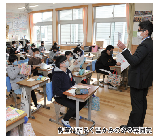
教室は明るく温かみのある雰囲気