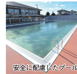
安全に配慮したプール