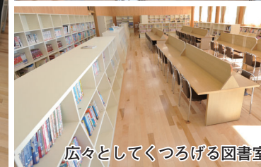
広々としてくつろげる図書室