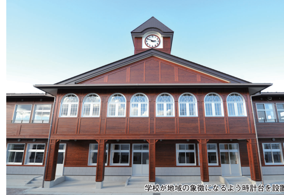
学校が地域の象徴になるよう時計台を設置