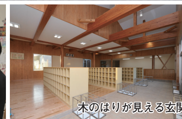
木のほりが見える玄関