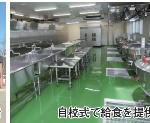
自校式で給食を提供