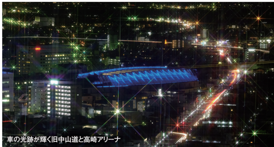
車の光跡が輝く旧中山道と高崎アリーナ