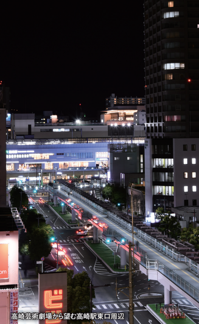
高崎芸術劇場から望む高崎駅東口周辺