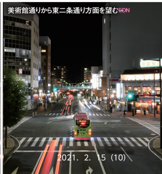
美術館通りから東二条通り方面を望む