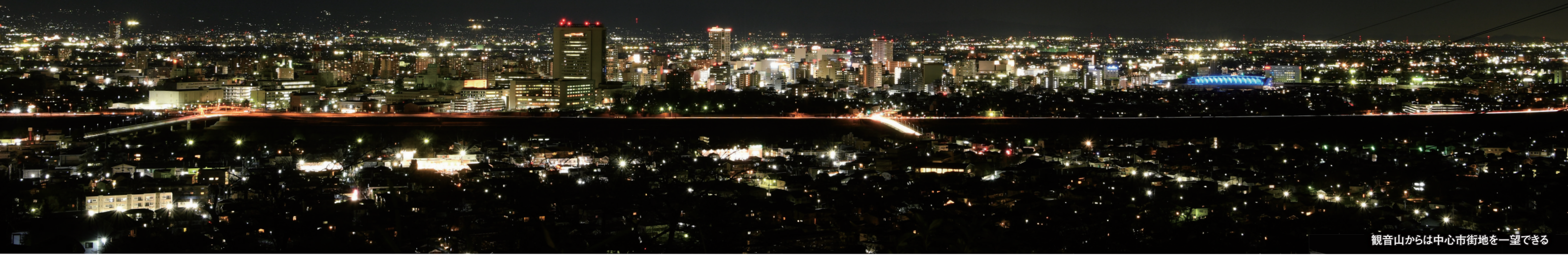
観音山からは中心市街地を一望できる

高崎で夜景を見るために出かけたことはありますか。空気の澄んだこの時期のきらめきは格別。市役所21階展望ロビーや観音山など高い場所からの景色や、ライトアップされた建物が作り出す風景などさまざまな夜景が楽しめます。問い合わせは、広報広聴課 ☎ 321-1205 へ。