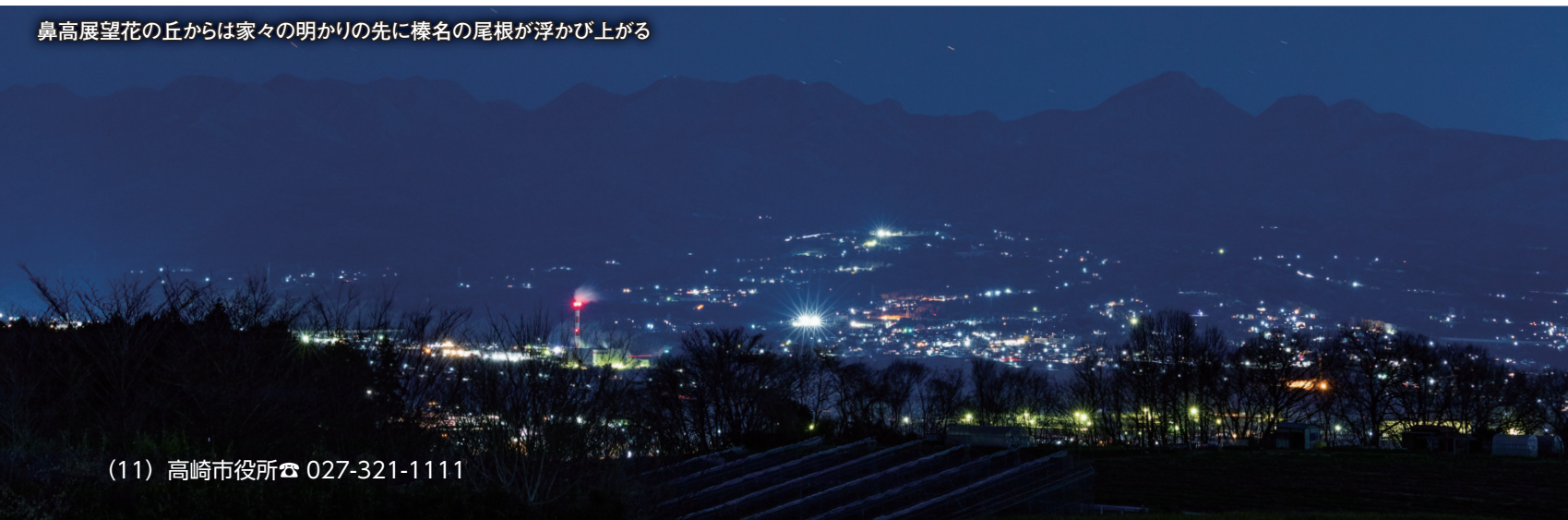
鼻高展望花の丘からは家々の明かりの先に榛名の尾根が浮かび上がる