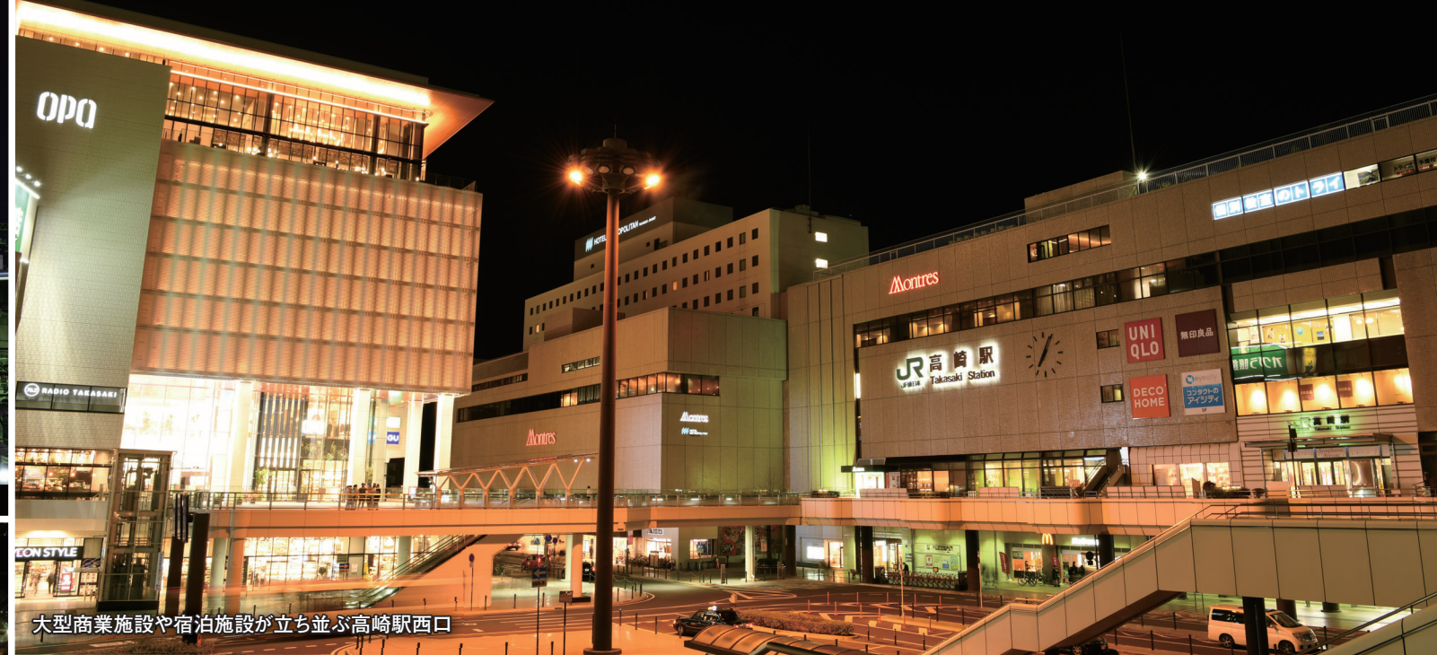
大型商業施設や宿泊施設が立ち並ぶ高崎駅西口