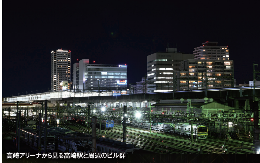
高崎アリーナから見る高崎駅と周辺のビル群