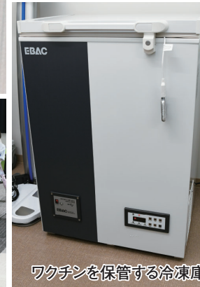
ワクチンを保管する冷凍庫