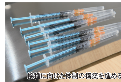
接種に向けた体制の構築を進める