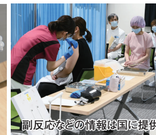
副反応などの情報は国に提供