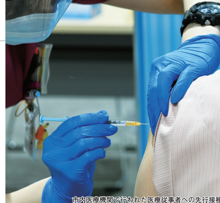
市内医療機関で行われた医療従事者への先行接種

*①医療従事者②65歳以上の人(誕生日が昭和32年4月1日以前)③基礎疾患のある人④高齢者施設などの従事者⑤60～64歳の人(誕生日が昭和32年4月2日～37年4月1日)⑥①～⑤以外の人