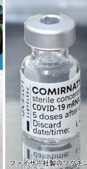
ファイザー社製のワクチン