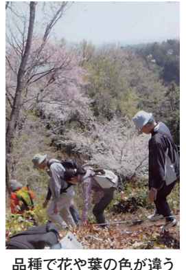
品種で花や葉の色が違う

午前10時30分～午後1時(売り切れ次第終了) ●会場1総合福祉センター ●内容1市内の障害福祉サービス事業所が作った季節の野菜やパン、革製品などの販売 ●問い合わせ1総合福祉センター(☎370・8822)