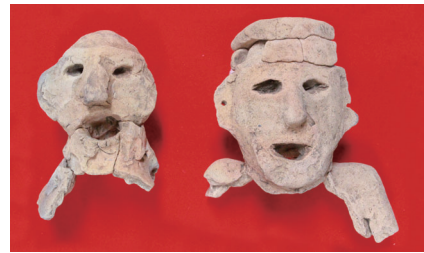
弥生時代の墓から出土した土人形土器