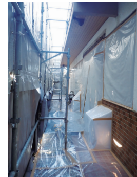
◀現場に応じた措置で飛散を防止

業者への工事発注の注意点 アスベストの調査や飛散防止の措置には、時間と費用がかかる場合があります。解体や修繕、リフォームの工事は