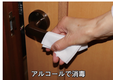
アルコールで消毒