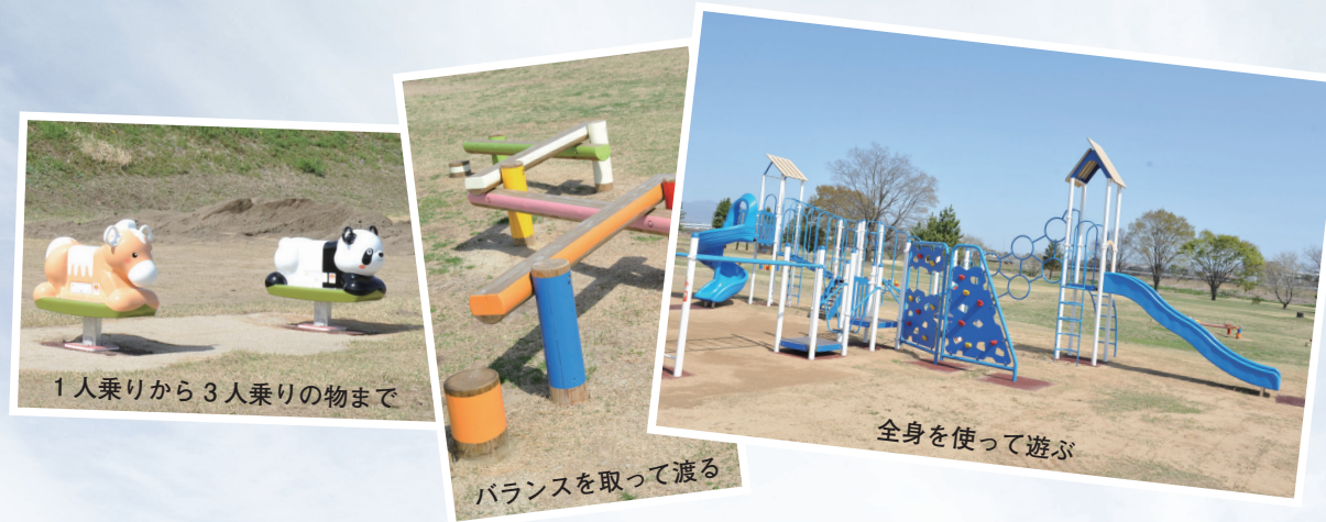
1人乗りから3人乗りの物まで