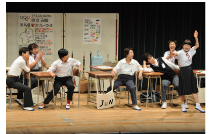
一昨年の公演の様子

市は、市民演劇の出演者と スタッフを募集します。演技・ 舞台などの経験は問いません。 市民演劇は、市民が演者や 裏方となってつくる劇です。演 目は、いろいろなおとぎ話が織 りなす「OTOGIBANASHI～