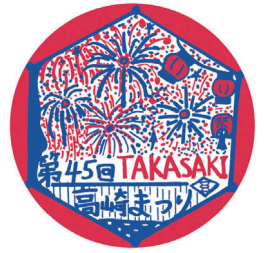
一昨年のデザイン

高崎まつり実行委員会は、9月4日(土)・5日(日)に開催する高崎まつりのワッペンデザインを募集します。 ●テーマⅡ山車 ●規格Ⅱ直径10センチの円に、下地の白色を含め3色で描き、「第47回高崎まつり」の文字を入れる ●申し込みⅡ5月7日(金)までに、〒370-8501高崎市役所観光課(☎321-1257)へ