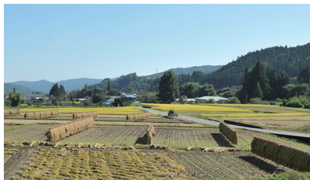
豊かな自然に囲まれて

問い合わせは、企画調整課（☎321-1202）へ。 ●対象＝金融機関などから融資を受けて、倉漕・榛名・吉井地域に自ら居住する住宅を取得し、同地域に住民票を移し、実際に居住する人。市内や同地域内からの住み替えも対象 ●対象となる融資内容＝次の①～⑤のいずれかに当てはまるもの①土地を取得するか借りて新たに住居を建てた②建売住宅を取得した③中古住宅を取得した④土地を先に取得し、その後住居を建てた⑤住居取得と併せてリフォームした ●利子補給の対象期間＝取得した住居の引き渡しを受けた日以降の最初の利子の支払いから5年 ●補給金額＝対象となる融資の利子5年（60か月）分全額 ●申し込み